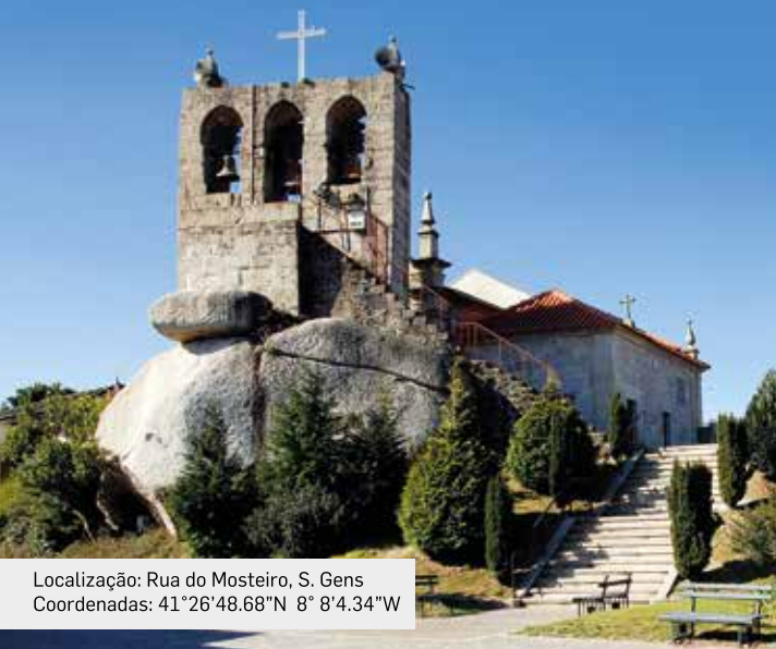
Localização: Rua do Mosteiro, S. Gens Coordenadas: 41°26'48.68"N 8° 8'4.34"W

No adro da igreja é possível observar algumas tampas de sepultura medievais inscritas e decoradas. Sobre a porta da capela mortuária surge outra tampa de sepultura reaproveitada na parede do edifício.