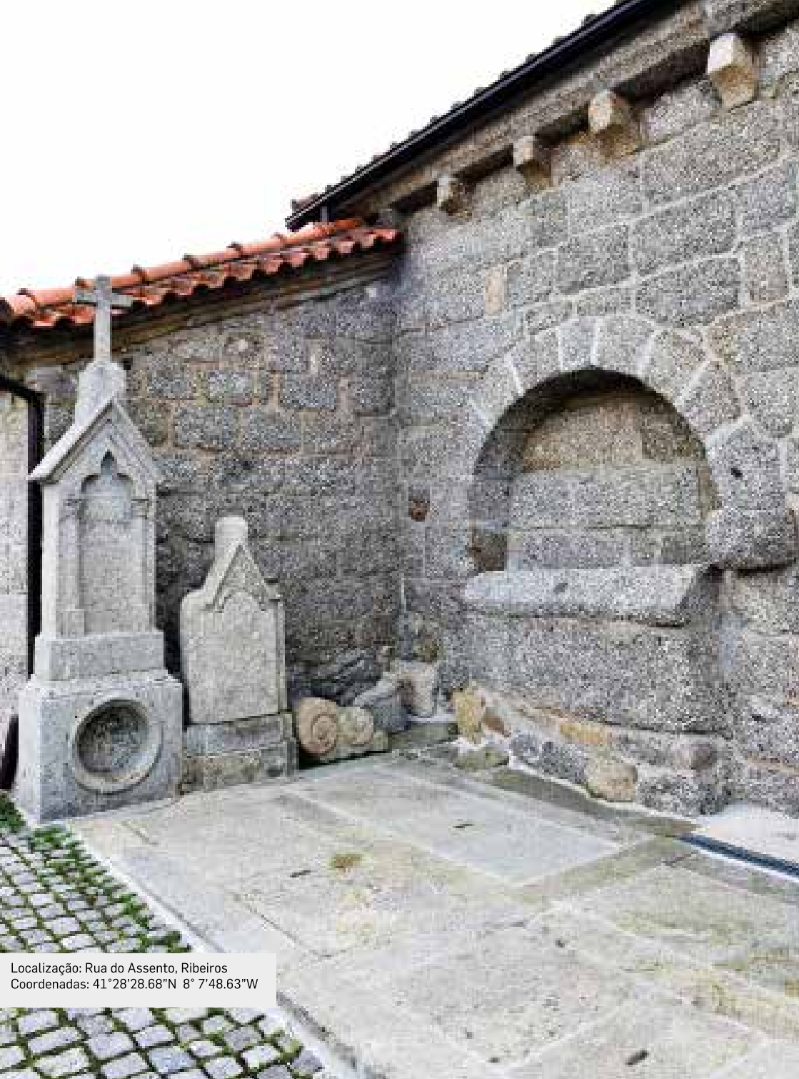
Localização: Rua do Assento, Ribeiros Coordenadas: 41°28'28.68"N 8° 7'48.63"W